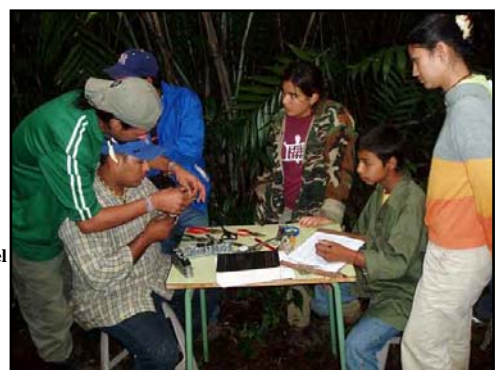
Momentos durante el entrenamiento